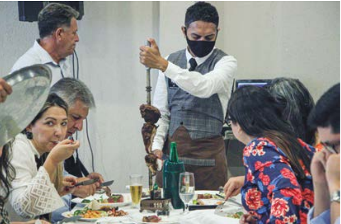
Otimismo vem após um dezembro marcado por recuperação parcial no setor de bares e restaurantes