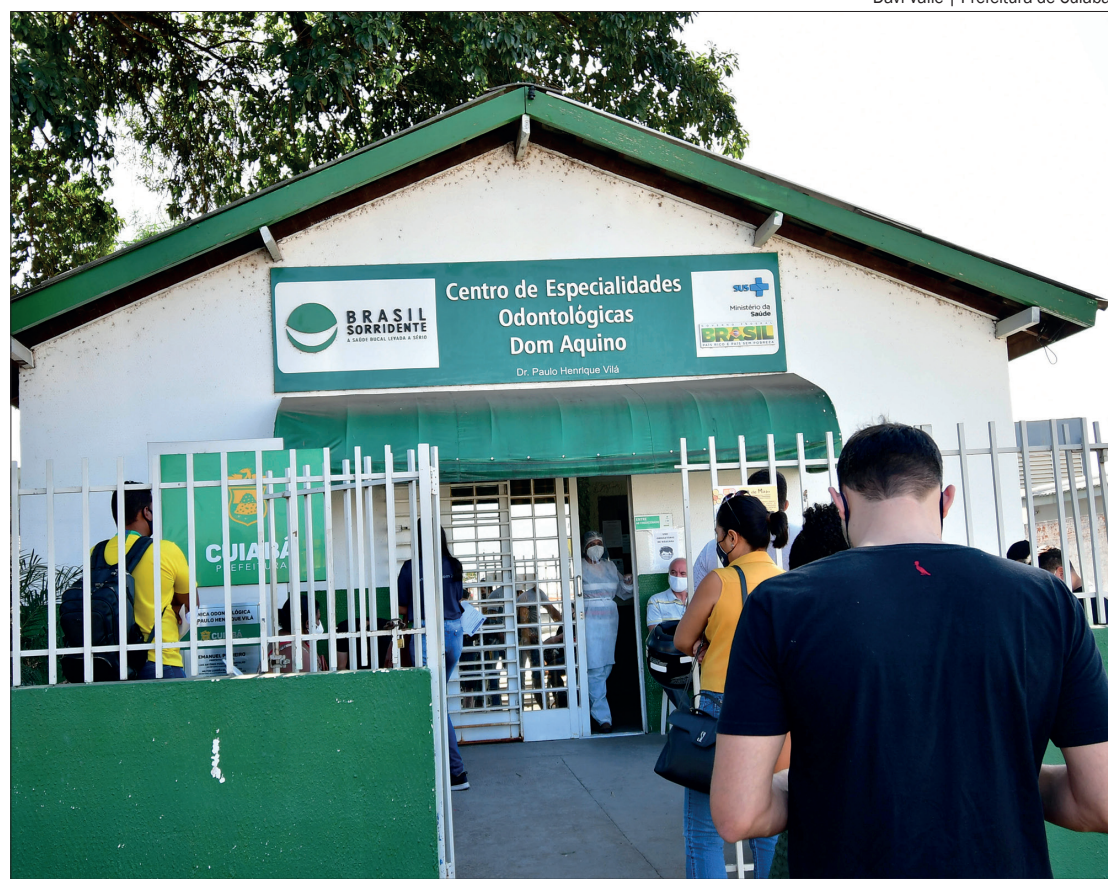
Os locais voltam a atender exclusivamente pacientes odontológicos