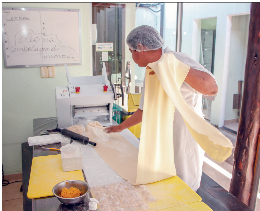
Programa já identificou algumas empresas qualificadas para exportação e dá auxílio nas negociações

Somado ao Imex, o município ainda possui outros programas ligadas ao 'Pra Frente Cuiabá', que devem entrar e