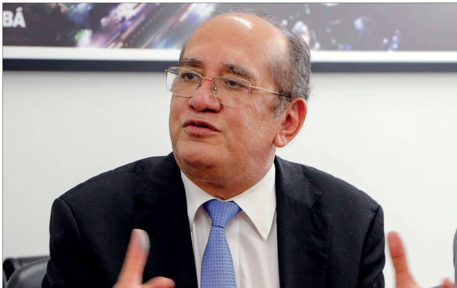
Conciliação mediada por Gilmar Mendes terminou sem acordo entre Estados e União sobre compensações

O economista pontua que, neste momento, o STF e secretários de Fazenda buscam encontrar uma metodologia para calcular essas per-