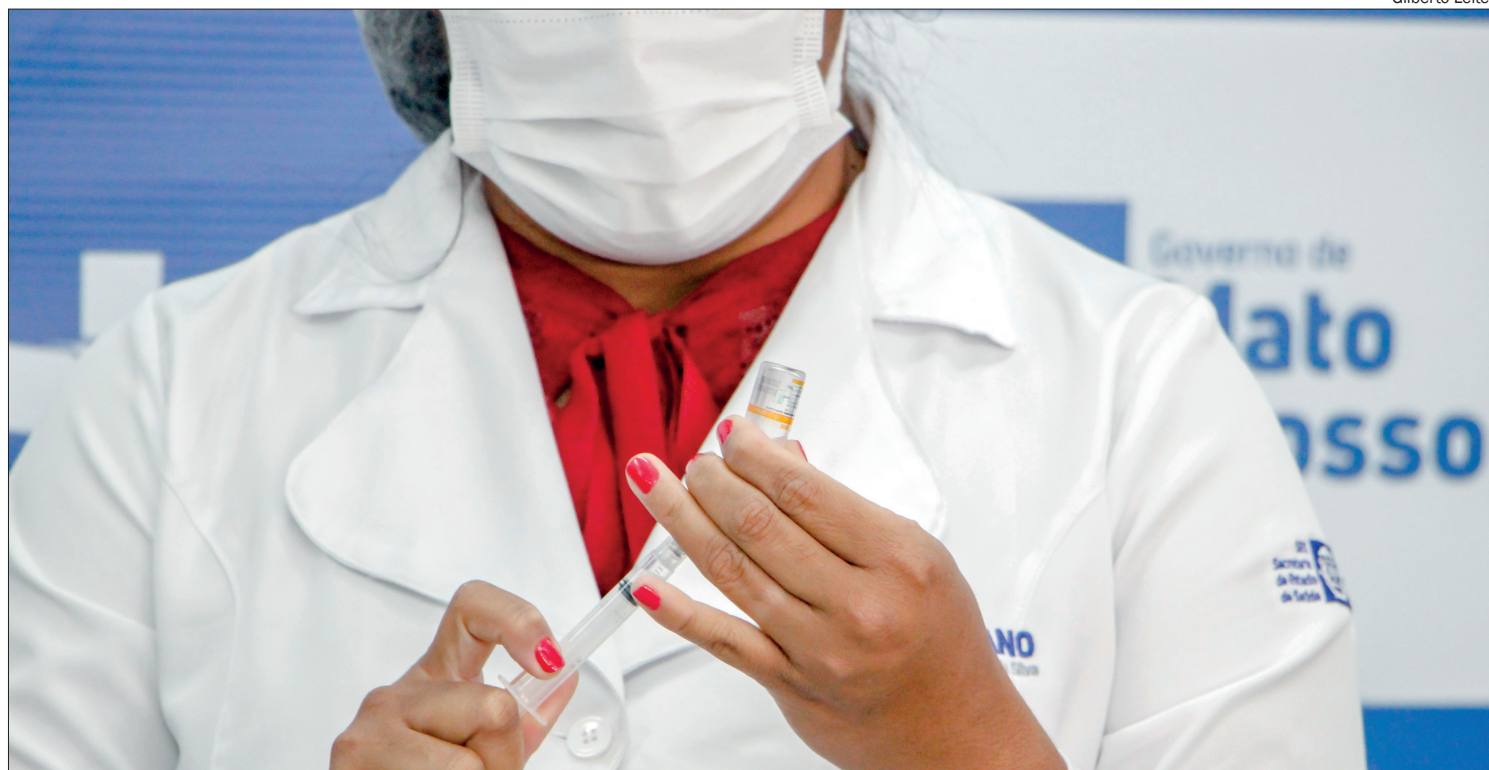
Campanha de vacinação contra a poliomielite inicia dia 15 de agosto em MT

As campanhas de vacinação contra a poliomielite e multivacinação coincidirão com a continuidade da vacinação contra a covid-19. “A vacina contra o coronavírus poderá ser administrada